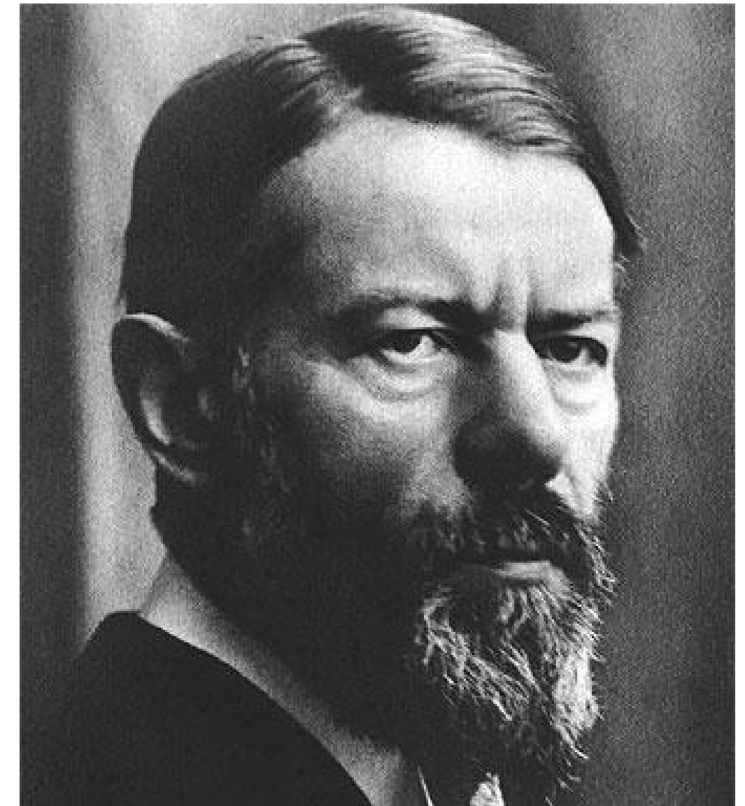
Alemania 1864 - 1920 Sociólogo, economista, jurista, historiador y politólogo